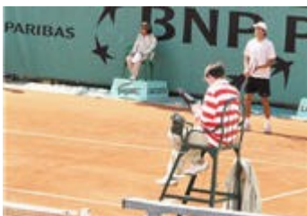
L'arbitre de chaise